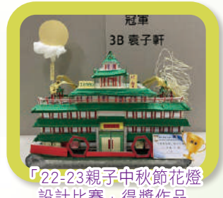
「22-23親子中秋節花燈設計比賽」得獎作品