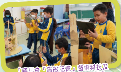
「賽馬會『敲敲記憶』藝術科技及文化教育計劃」多媒體展示活動