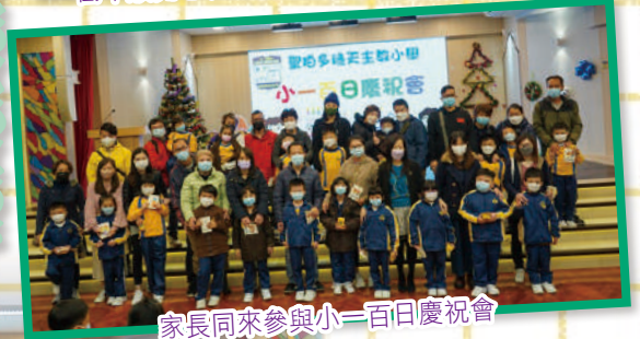
家長同來參與小一百日慶祝會