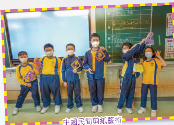
中國民間剪紙藝術