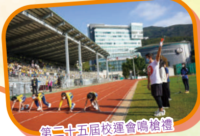
第二十五屆校運會鳴槍禮

本年度體育科活動相當精彩，久違多年的校運會再度舉行，學生家長皆盡情投入，氣氛熱烈！學生亦首次參觀國際七人欖球賽，能夠見識世界級別的運動比賽，真的大開眼界！於體育課堂中，同學亦有機會體驗新興運動——地壺球及旋風球，看似簡單易明的技巧及規則，當中培養了同學的協作和解難能力，既易上手又富挑戰性！