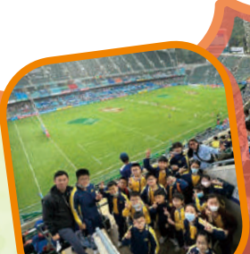
欣賞國際七人欖球賽