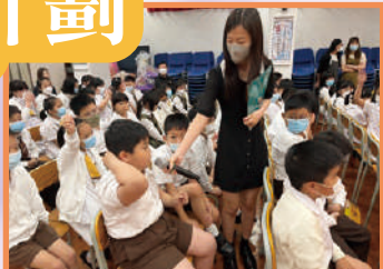
世界閱讀週活動——學生閱讀講座