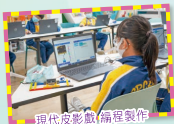
現代皮影戲 編程製作