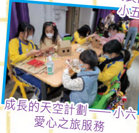
成長的天空計劃——小六愛心之旅服務