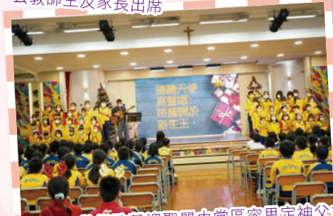
將臨期——歡樂歌聲迎聖嬰由堂區容思定神父主禮