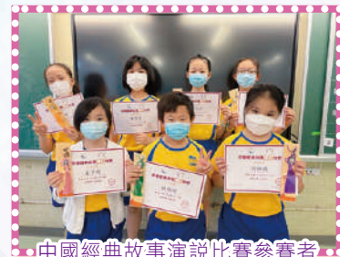
中國經典故事演說比賽參賽者