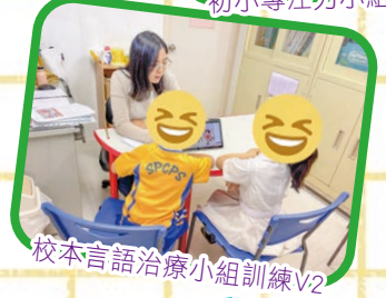
校本言語治療小組訓練V2