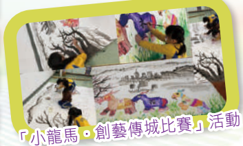
「小龍馬·創藝傳城比賽」活動