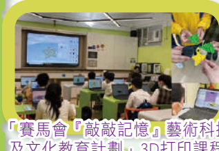
「賽馬會『敲敲記憶』藝術科技及文化教育計劃」3D打印課程