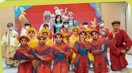
「第四輪學校與藝團伙伴計劃」粵劇班