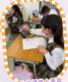
學生在課堂上善用電子科技學習，展示學習成果