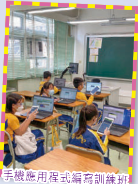
手機應用程式編寫訓練班