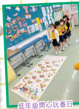
低年級開心玩番日

此外，生命教育活動，例如：小一百日慶祝會、小四生涯規劃體驗，以及校園大清潔行動等主題活動，讓學生在家、在校都能實踐「敬主愛人、修德力學」的校訓精神。