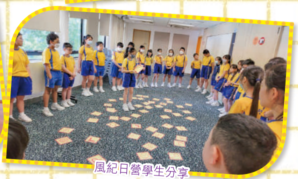
風紀日營學生分享