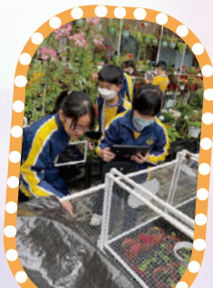
四年級學生開心遊校園，啟發寫作