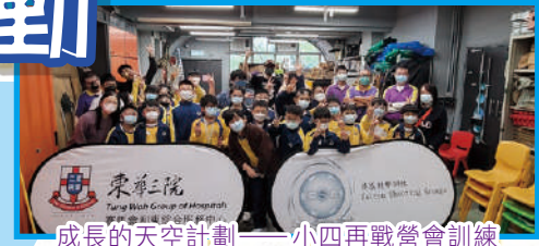
成長的天空計劃——小四再戰營會訓練