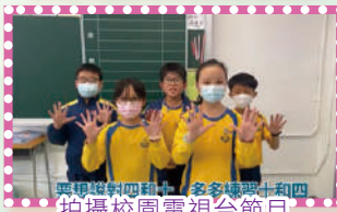
與提燈的同學，在多媒體課十和四拍攝校園電視台節目