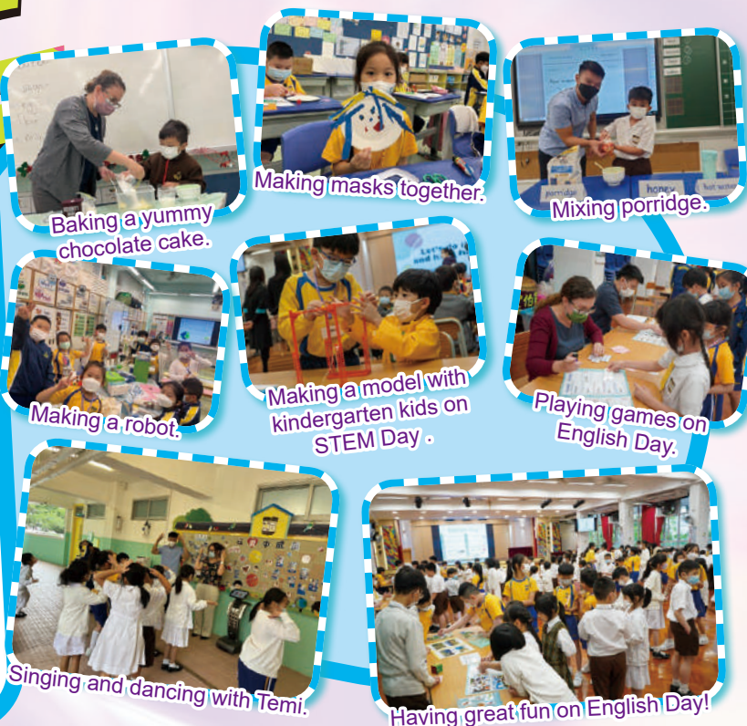
Baking a yummy chocolate cake.

In addition, we now have games in the school hall every Day 1 and Day 4 during lunch recesses. Students participate actively in the activities. All of them engage in a fun and amusing English learning environment. They also sing songs with Temi the robot and have games in their classrooms during the first and second recesses. The students can get stamps and win prizes by playing the games. The students find it motivating and fun.