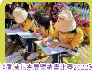
《香港花卉展覽繪畫比賽2022》

本校重視學生的視藝發展。本年度，為加強學生對傳統中國藝術文化的興趣和認識，學校參加了由藝術發展局主辦的「第四輪學校與藝團伙伴計劃」，與碧海粵劇團合作，為四、五年級開辦粵劇班。另外，亦參加了由香港賽馬會慈善信託基金捐助，設計及文化研究工作室主辦的「賽馬會『敲敲記憶』藝術科技及文化教育計劃」，讓學生透過更多元、現代和親和的方式接觸傳統中國文化。為擴闊學生在視藝的眼界及豐富學習經歷，本年度視藝科除參與一般恆常校外比賽外，還於校內舉辦不同的藝術創作比賽及活動，例如：「親子中秋節花燈設計比賽」、「小五篆刻金句活動」、「親子賀新春飾物設計比賽」、「網上學生作品展」、「小六畢業生壁雕創作」、「網上親子雲遊博物館」等，讓不同年級的同學有更多視藝創作的機會。