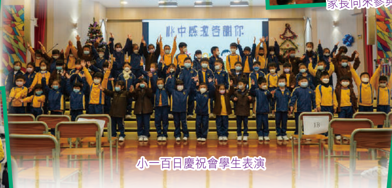
小一百日慶祝會學生表演