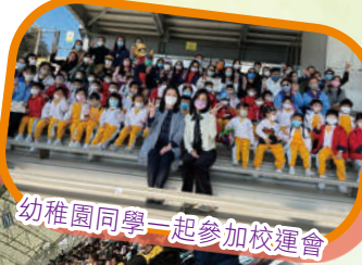
幼稚園同學一起參加校運會