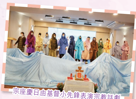
宗座慶日由基督小先鋒表演宗教話劇