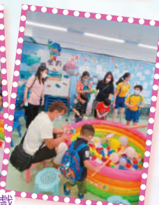
學校開放日攤位遊戲