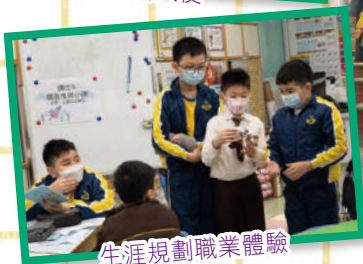
生涯規劃職業體驗