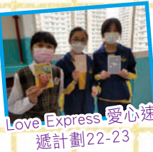
Love Express 愛心速遞計劃22-23

正向心理學相信每個人也擁有二十四個品格優勢，並且沒有高低之分，我們在不同的處境下，會展現不同的品格優勢。本學年，學校透過成長課、輔導活動、學生講座等，培養學生「超越」及「正義」的美德。此外，學校亦透過「成長的天空計劃」，提升學生抗逆能力，建立關愛尊重並充滿正能量的校園文化。