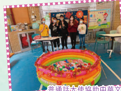
普通話大使協助中華文化日活動