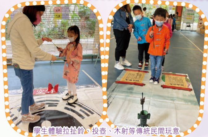
學生體驗拉扯鈴、投壺、木射等傳統民間玩意