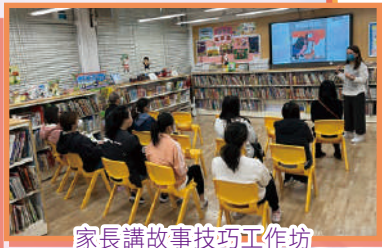
家長講故事技巧工作坊