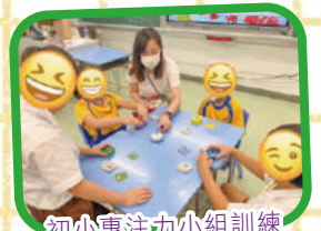
初小專注力小組訓練