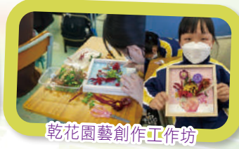
乾花園藝創作工作坊