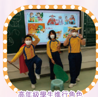
高年級學生進行角色扮演，演繹故事情節