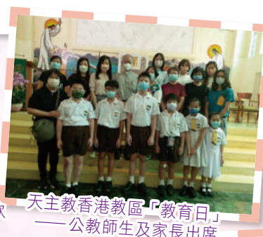
天主教香港教區「教育日」——公教師生及家長出席