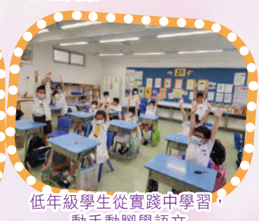
低年級學生從實踐中學習，動手動腳學語文