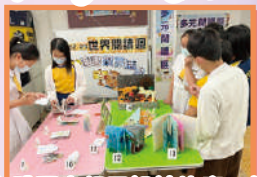
「立體圖書親子設計比賽」投票

本校積極推廣閱讀，更成立專責小組統籌推動閱讀事宜。本年度的閱讀活動包括「閱讀足印」獎勵計劃、「立體圖書親子設計比賽」、推廣閱讀電子圖書、世界閱讀週活動、以戲劇形式演繹故事並參加學校戲劇節等。圖書組會訂立與課程有關的閱讀主題，指導學生閱讀策略，以增強學生的學習能力，幫助學生發展從閱讀中學習的能力。