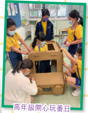
高年級開心玩番日