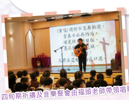
四旬期祈禱及音樂聚會由福頭老師帶領唱歌