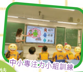
中小專注力小組訓練

每年為小一學生進行及早識別和輔導，為有特殊學習需要的學生提供不同的支援服務，包括：功課調適、測考調適及個別輔導計劃等；學校按學生需要外購服務或參加合作計劃，如專注力訓練小組、執行技巧訓練小組、社交小組等；另有駐校心理學家及言語治療等專業服務，為學生及家長提供支援。