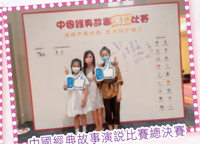
中國經典故事演說比賽總決賽