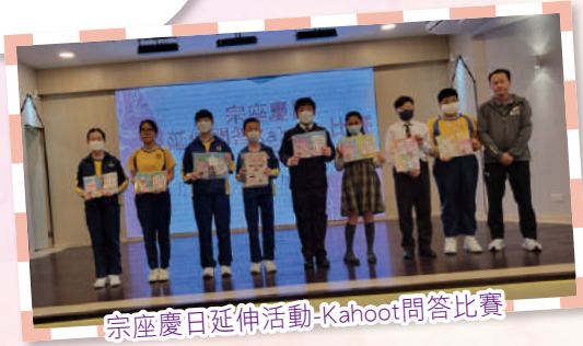
宗座慶日延伸活動-Kahoot問答比賽