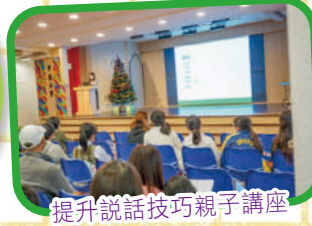
提升說話技巧親子講座