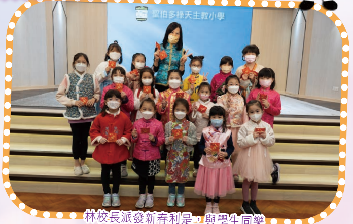
林校長派發新春利是，與學生同樂