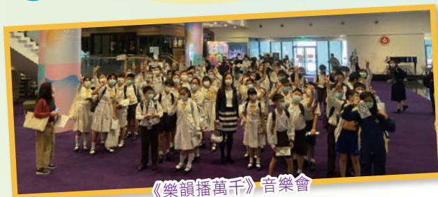
《樂韻播萬千》音樂會

此外，本校設有不同的音樂課外活動及課後小組，有小結他、中國鼓、合唱團、手鐘隊及節奏樂等。