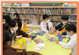
四年級圖書課——南區LAPBOOK設計