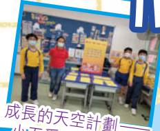
成長的天空計劃——小五愛心之旅服務