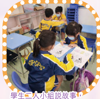
學生二人小組說故事，以說帶寫樂分享