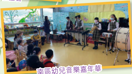
南區幼兒音樂嘉年華