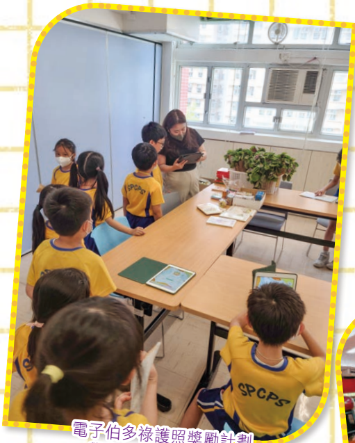
電子伯多祿護照獎勵計劃 學生於午息換領獎勵